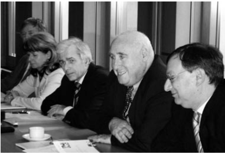
Mitglieder des BAGFW-Vorstandes bei ihrer Sitzung im Mai 2007

Angebot der Wohlfahrtsverbände, sie bei der Schulung von Fallmanagern zu unterstützen. Die Bundesagentur für Arbeit plane, eine Bildungsplattform im Internet einzurichten, über die auch die Wohlfahrtsverbände ihre Ausbildungsangebote anbieten könnten.