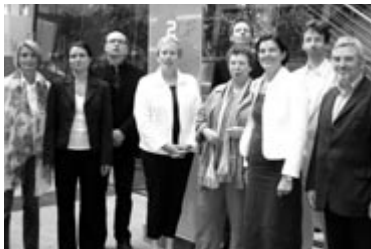
Jurysitzung im ZDF-Hauptstadtstudio