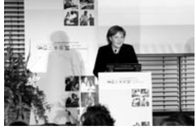
Die Bundeskanzlerin Dr. Angela Merkel zu Gast beim Deutschen Sozialpreis

Hemmnisse in den politischen, rechtlichen oder administrativen Rahmenbedingungen abzubauen beziehungsweise Anreize und Erleichterungen für die Einbürgerung zu schaffen. Die BAGFW konkretisierte mit diesem Vorschlag die Vereinbarung des letzten gemeinsamen Gesprächs vom 30. März 2006, integrationspolitische Maßnahmen der Bundesregierung kritisch zu begleiten.