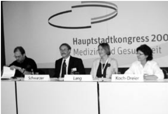
Die BAGFW auf dem Hauptstadtkongress 2007 – Freiwilliges Engagement in der Betreuung Demenzkranker

Weitere Berichte zu Fachtagungen finden sich in den jeweiligen Arbeitsbereichen; der Pflegekongress im Rahmen des Hauptstadtkongresses wird im Arbeitsbereich Qualitätsmanagement dargestellt.