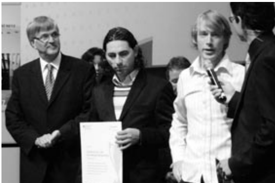
Preisverleihung „Wege ins Netz“ auf der IFA

Der Parlamentarische Staatssekretär beim Bundesministerium für Wirtschaft und Technologie Peter Hintze ehrte am 3. September die Preisträger des Wettbewerbs „Wege ins Netz 2007“. Die Bühne des Zweiten Deutschen Fernsehens auf der Internationalen Funkausstellung (IFA) bildete den Rahmen für die Preisverleihung.