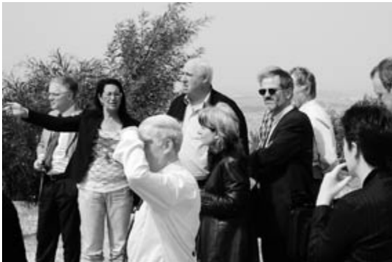
An der Grenze von Gaza erläutert die Leiterin des Kulturzentrums die Lage der Einwohner

Die Bürgermeister dieser beiden im Norden Israels gelegenen Städte unterrichteten die Teilnehmenden über die Folgen der Raketenangriffe während des Libanonkrieges im Sommer 2006. 33 Tage habe der Libanonkrieg die Zivilbevölkerung in Atem gehalten. In Kirjat-Schmonah seien in dieser Zeit mehr als 1.000 Raketen niedergegangen, 25 Prozent der Gesamtzahl. 2.000 Wohnungen, sieben Schulen und 20 Kindergärten seien getroffen worden. Zwei von drei Einkaufszentren seien angegriffen worden. Der Bürgermeister von Naharija ergänzte, dass seine Stadt täglich mit 50 bis 60 Raketen belegt worden sei. Für die Zivilbevölkerung hätte dies ein Leben „unter der Erde“ bedeutet.