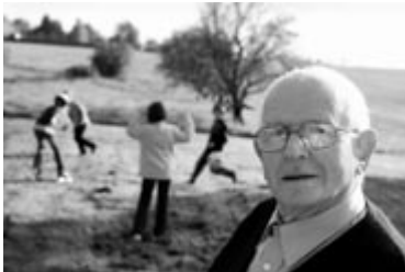
„Einsatz für den Nachwuchs“, Arbeiterwohlfahrt

Leuchtend gelbe Wände, in die Fassade eingesetzte Steinsäulen, bunte Blumenkübel neben der Eingangstür: Die ungewöhnliche Gestaltung des Hauses fällt sofort auf. Noch vor zwei Jahren sah es aus wie jedes andere Haus im Dorf – bis die Heimbewohner sich einen Kalender des Künstlers Friedensreich Hundertwasser anschauten und selbst zum Pinsel griffen. Doch nicht nur bei der Hausfassade lassen die Bewohner des Jugendheims freien Lauf. Zur Kreativtherapie gehört auch das Beschäftigen mit Materialien wie Holz, Metall und Textilien. Das hilft den traumatisierten Jugendlichen, ihre Vergangenheit zu verarbeiten. So werden erste Ziele erreicht und das Selbstwertgefühl gestärkt – wichtige Schritte bei der Vorbereitung auf ein Leben in der Gesellschaft.