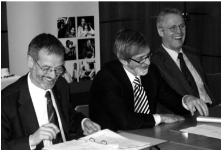
Gespräch mit dem Botschafter Shimon Stein zur Vorbereitung der Israelreise

bekräftigten, dass in der israelischen Bevölkerung noch immer die tiefe Friedenssehnsucht überwiege. Eine nicht handlungsfähige Regierung der Palästinenser, die ihrerseits als Spielball insbesondere vom Iran und Syrien missbraucht würde, ließen derzeit ernsthafte Schritte zur Beilegung des Nahost-Konfliktes nicht zu. Deshalb habe Israel handeln müssen, um zum Schutz der israelischen Bevölkerung die Zahl der Selbstmordattentate einzudämmen. Nur aus diesem Grund sei die Grenze befestigt und eine Mauer errichtet worden. Eine Entscheidung über die zukünftige Grenzziehung sei damit ausdrücklich nicht verbunden. Dass die Bewegungsfreiheit der Palästinenser durch die Sicherungsanlagen teilweise massiv eingeschränkt werde, gestanden die israelischen Gesprächsteilnehmer auf kritische Nachfragen hin zu. Indes: Der Erfolg dieser Maßnahmen gebe der israelischen Regierung Recht. Seit Errichtung dieser „Mauer“ hätten die Zahl der Selbstmordattentate und der Beschuss von wichtigen Verkehrsadern sowie Dörfern um mehr als 85 Prozent vermindert werden können. Nur mit diesem Erfolg sei auch zu verstehen, dass diese Sicherheitspolitik der israelischen Regierung in der Bevölkerung überwiegend Zustimmung fände.