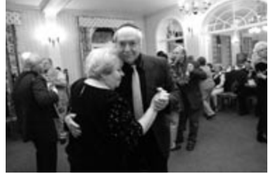
„Willkommen und Schalom“, Zentralwohlfahrtsstelle der Juden in Deutschland