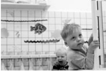
„Hilfe ohne Umweg“, Deutscher Caritasverband