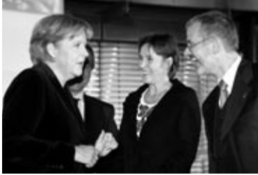
Die Bundeskanzlerin und der BAGFW-Präsident im Gespräch mit den Preisträgern