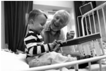
„Lach dich gesund“, Der Paritätische

„Pflege in Not“ ist bundesweit eine der wenigen Einrichtungen, die den pflegenden Angehörigen psychologische Hilfe leistet. Das Projekt des Diakonischen Werkes Berlin Stadtmitte e.V. erhielt 12.000 Euro aus den Zuschlagserlösen der Wohlfahrtsmarken.