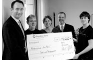
Nachlese: Übergabe des Schecks an die Förderschule

Mit Ihrer Teilnahme am Festakt und ihrer Gastrede unterstrich die Bundeskanzlerin die Bedeutung des Medienpreises der BAGFW: „Der Deutsche Sozialpreis dient dem besseren Kennenlernen von Problemen in unserem Land. Mit diesem Preis wird ein sozial engagierter und kritischer Journalismus gewürdigt. Er wird damit gefördert, und zwar jenseits des Quotendrucks und der Auflagenstärke, einfach um des Beitrags willen. Ich glaube, gerade in einer Zeit, in der die Frage, wie viel Aufmerksamkeit etwas findet, eher an Bedeutung zu- als abnimmt, ist dieser Preis außerordentlich wichtig. Ich würde also sagen: Er hat in den letzten 36 Jahren aus meiner Sicht an Bedeutung gewonnen. Soziales Engagement sollte auch weitgehend unabhängig von wirtschaftlichen Erwägungen möglich sein. Dass Sie so viele Bewerbungen um diesen Preis hatten, zeigt, dass das auch so ist.“