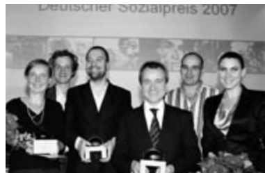
Die Preisträger 2007