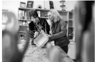
„Hilfe zur Selbsthilfe“, Deutsches Rotes Kreuz