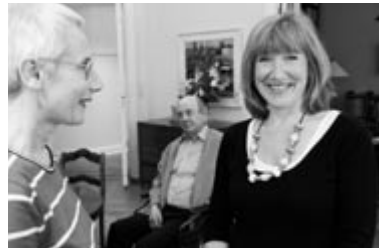
„Wege aus der Krise“, Diakonisches Werk der EKD