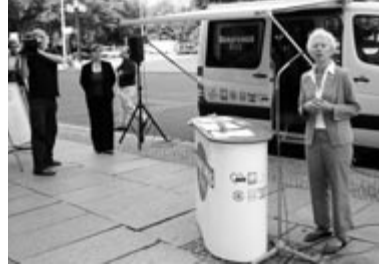
Geförderte Projekte der GlücksSpirale

Für Rückfragen und für die persönliche Beratung der Einrichtungen bei ihrer Öffentlichkeitsarbeit wurden Koordinatoren aus den verschiedenen Verbänden benannt.