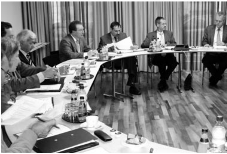
BAGFW-Vorstandssitzung beim DCV in der Hauptvertretung Berlin

Auf Nachfrage teilte die SPD-Fraktion mit, dass es vorgesehen sei, dass der Lohnkostenzuschuss nicht nur einmalig, sondern immer wieder für zwei Jahre wiederholt werden könne. Die aktuelle zweijährige Ausgestaltung habe arbeitsrechtliche Gründe. Eine Sachgrundbefristung könne immer wieder wiederholt werden. So könne auch eine dauerhafte Förderung erreicht werden.