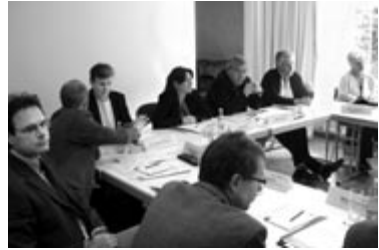
Ist gute Pflege messbar? – Diskussionsrunde Qualitätsentwicklung

unterschiedlicher Perspektiven soll im Projekt aufgegriffen werden, das heißt, Indikatoren im Zusammenhang mit Lebensqualität und Wohlbefinden der Bewohnerinnen und Bewohner sollen sich hier wieder finden. Mit dem Projektvorhaben „Indikatoren für Ergebnisqualität“ begeben sich die in der BAGFW kooperierenden Verbände in die Offensive und leisten einen Beitrag zur Versachlichung der Debatte über Pflegequalität. In den Verbänden der Freien Wohlfahrtspflege wird dieses Vorhaben mit großem Interesse verfolgt. Die zahlreichen Meldungen von Einrichtungen, die sich als Piloteneinrichtungen beteiligen wollen, bestätigen die Initiative.